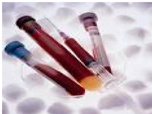
血清肌酐 \geq 10.0 mg/dl