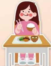
術後可以提早進食