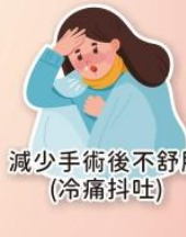
減少手術後不舒服 (冷痛抖吐)