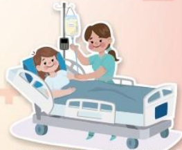
客制化術前照護與準備