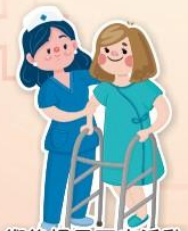
術後提早下床活動